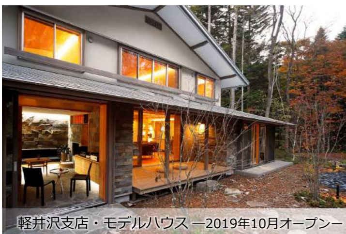
軽井沢支店・モデルハウス —2019年10月オープン—

「信州に根差し、信州で豊かに生きるライフスタイルを届けたい」。基本姿勢はそのままだ、これまでに類を見ないフォレストコーポレーションの新しい姿にあふれたそれぞれの拠点。次はどんな新拠点が形になるのかと、社員も心躍るこの一年間でした。 そして来たる二〇二〇年、フォレストコーポレーションは創業六〇周年を迎えます。これもひとえに、オーナー