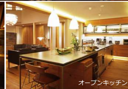
オープンキッチン