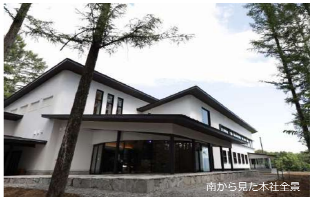
南から見た本社全景