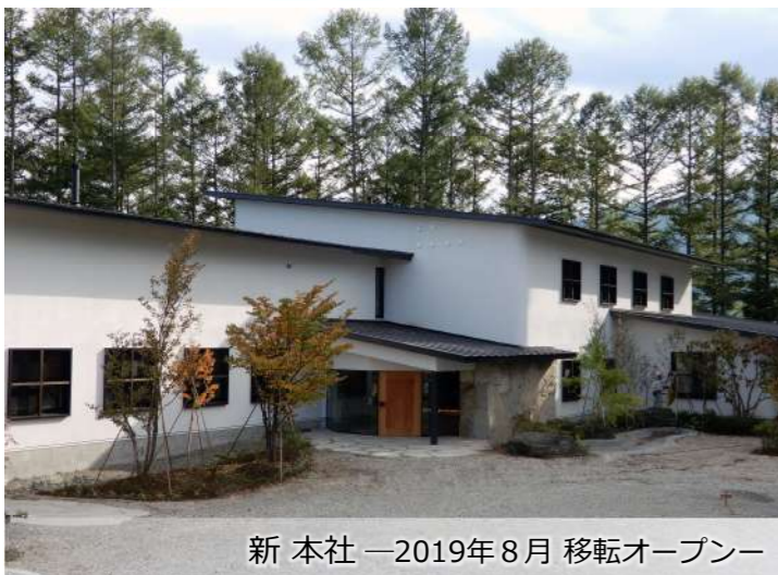
新 本社 —2019年8月 移転オープン—