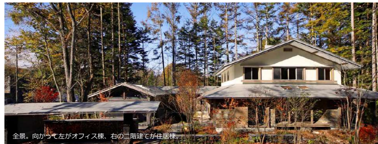
全景。向かって左がオフィス棟、右の二階建てが住居棟。

今秋、いよいよ軽井沢支店を開設いたしました。国内外から注目されるブランド力を誇る軽井沢を拠点に「信州で豊かに生きる」ライフスタイルを力強く発信し、地方創生のリーディングカンパニーとなるべく頑張っております。 そして、軽井沢出店を機にスタートするフォレストコーポレーションの2つの新事業——別荘事業と、企業向け「信州の第三のオフィス」サードオフィスの発売を開始いたします。 サードオフィスは、都心にオフィスを構える企業が時に信州の環境に身を置き、