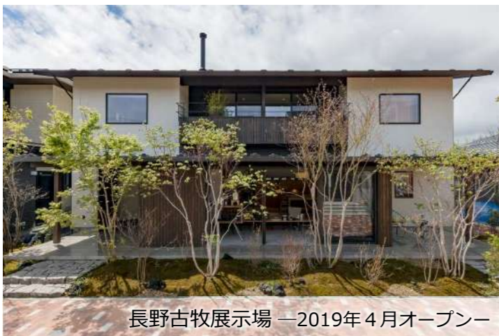
長野古牧展示場 —2019年4月オープン—

令和の幕開けを迎えた二〇一九年。私たちフォレストコーポレーションでは、新時代にふさわしい新しい拠点が次々と誕生しています。 春には「長野古牧展示場」、夏には「新本社」、秋には「軽井沢支店・軽井沢モデルハウス」がオープン。さらに来月二月、シーズン南原分譲地(上伊那郡南箕輪村)には、四代目となるモデルハウスの完成を控えています。